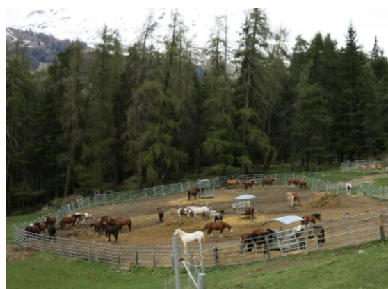
Reitstall San Jon, Scuol