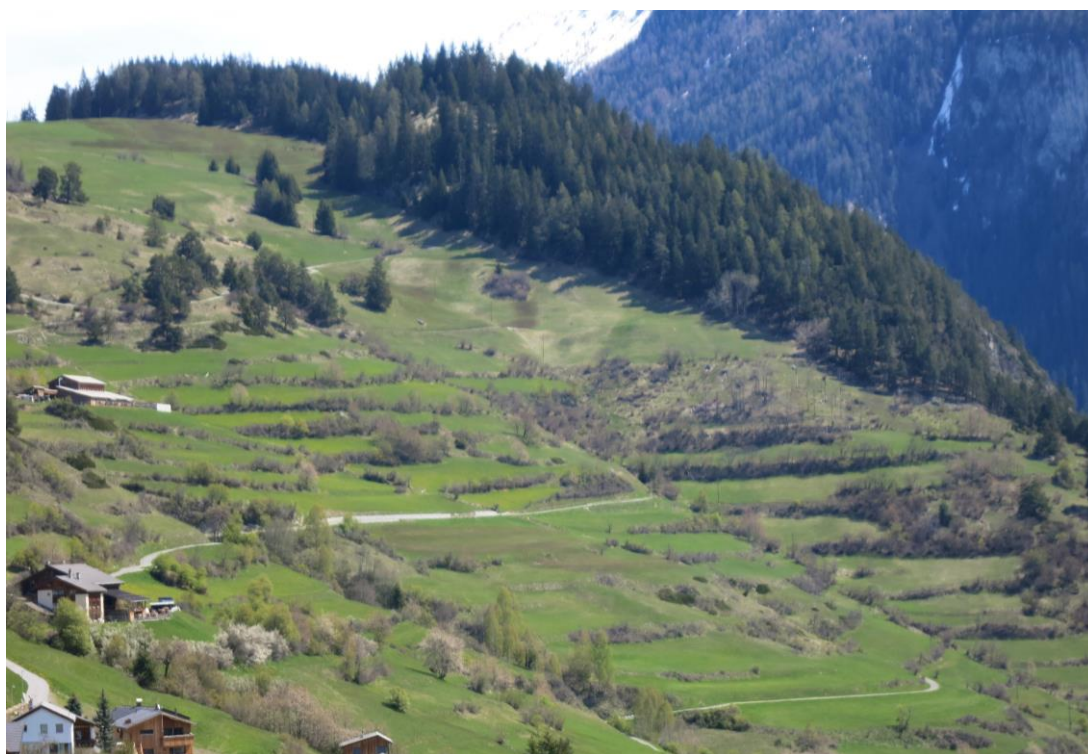
Terrassenlandschaft bei Ramosch